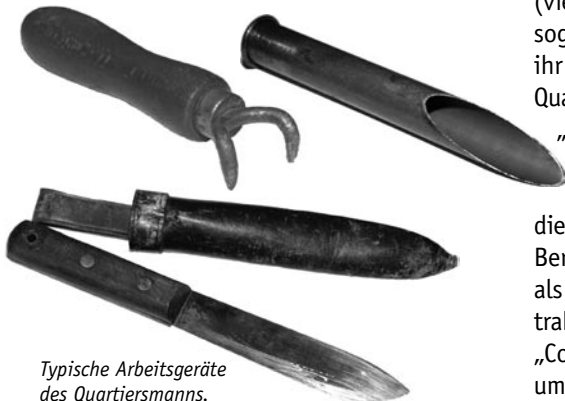
Typische Arbeitsgeräte des Quartiersmanns.

Die neuen Hallen haben zwar nicht den Charme der alten Böden, doch kommen sie wie die alten Speicher ganz ohne Klima-