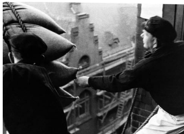
Die Arbeit der Quartiersleute war schwer und oft gefährlich.

(links) Die bis zu 100 Kilo schweren Kaffee- und Kakaosäcke mussten häufig auf den Schultern getragen werden.