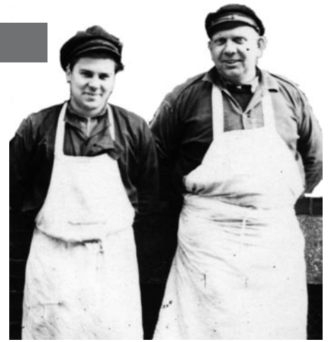
Zur Arbeitskleidung der Quartiersleute gehörten die weißen Platen (Schürzen).

Als 1888 in Hamburg der Zollanschluss an das Deutsche Reich zur Errichtung des Freihafens führte, mussten Speicher hinter den Zollstationen errichtet werden. Das geschah zügig, so dass noch 1888 die